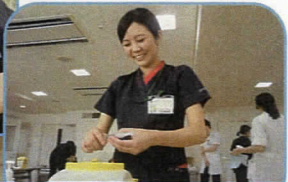
採血・静脈留置針