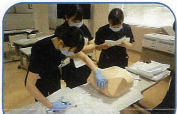
膀胱留置カテーテル