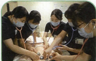
フィジカルアセスメント