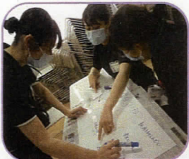
ディスカッション