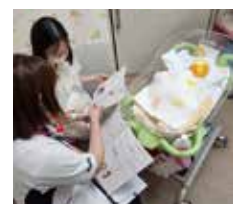
赤ちゃんとの生活について、説明させていただきます