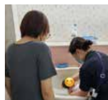
退院前には沐浴指導も行っていきます